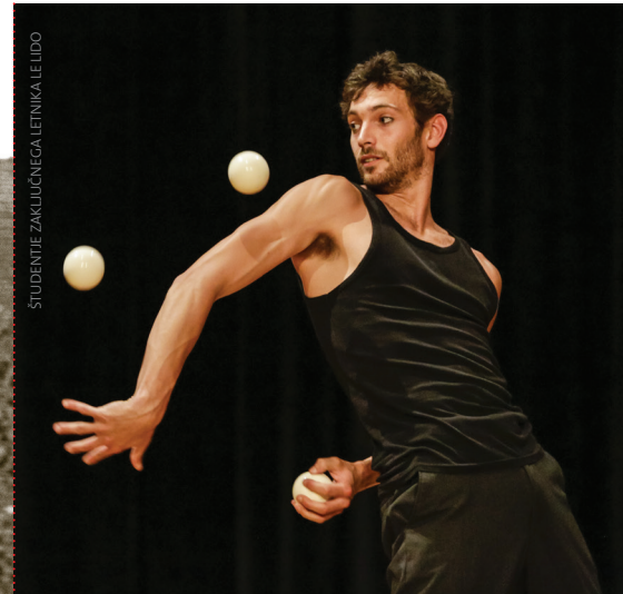
STUDENTJE ZAKLJUČNEGA LETNIKA LE LIDO

(V primeru slabega vremena predstava odpade.)